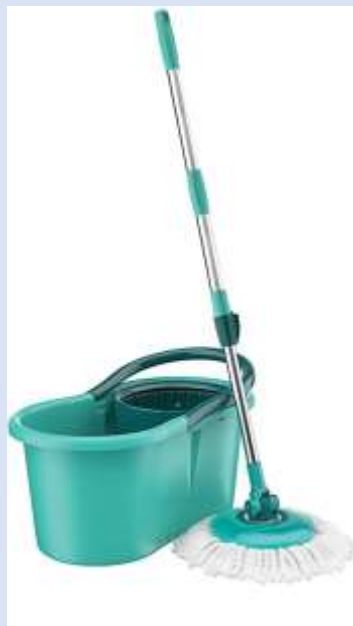
Imagem ilustra um MOP:

55. Quanto à limpeza de janelas, é correto afirmar: